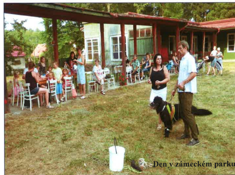
Den v zámeckém parku