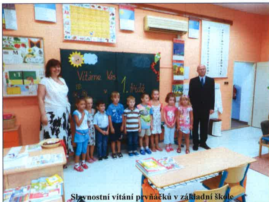
Slavnostní vítání prvňáčků v základní škole