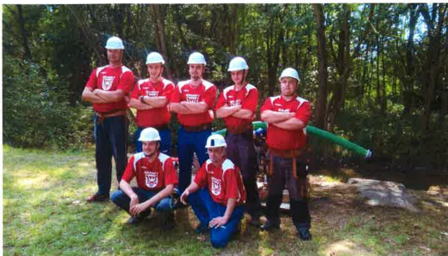
Družstvo SDH Branky na soutěži v Choryni