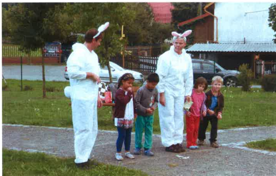
Cesta pohádkovým lesem