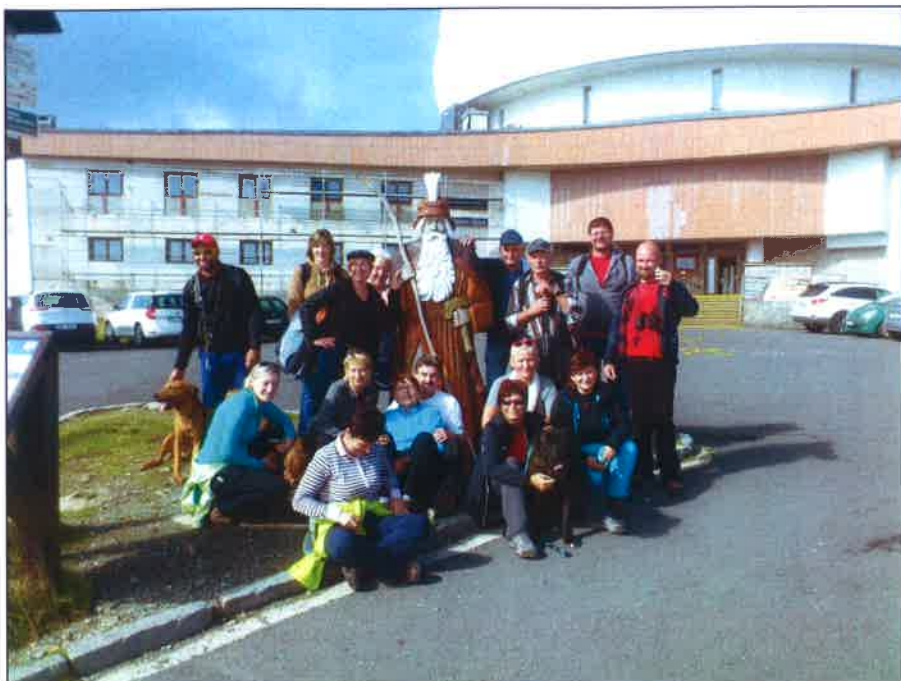
Naši turisté na nejvyšším místě Moravy - Pradědu