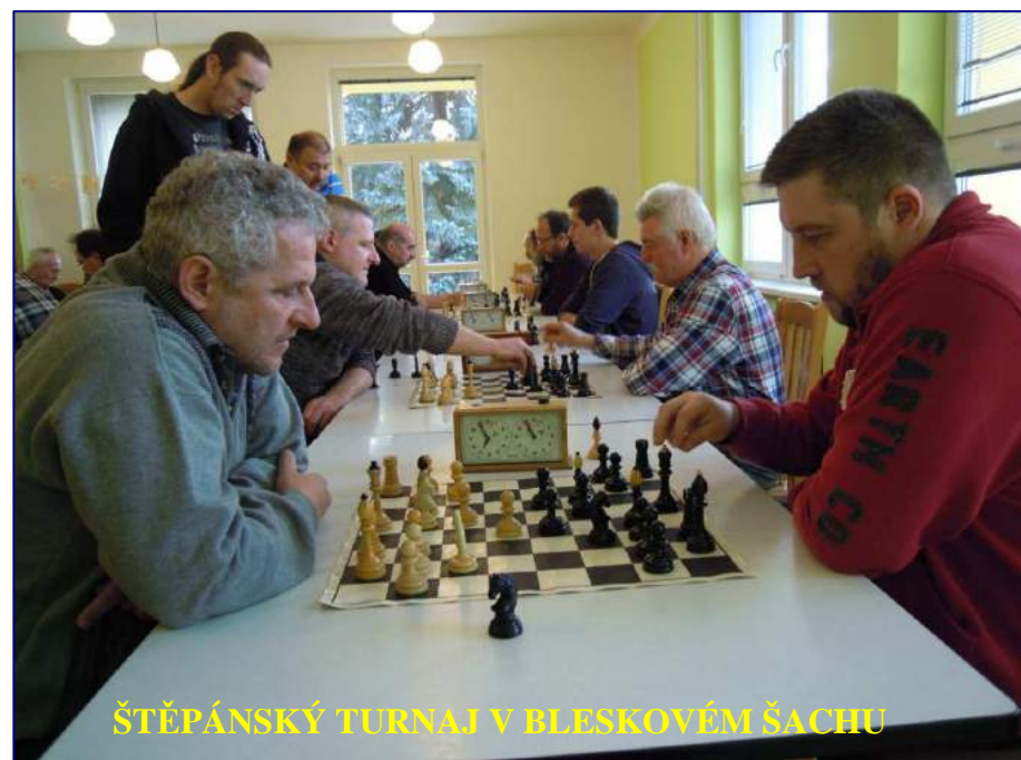
ŠTĚPÁNSKÝ TURNAJ V BLESKOVÉM ŠACHU