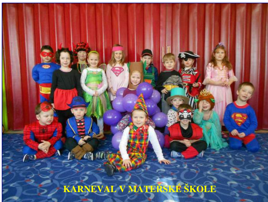
KARNEVAL V MATĚRSKÉ ŠKOLE